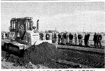
昨年度に実施したモデル工事 (筑西土木事務所)

県土木部は、ICTを活用した工事の実施要領を改訂した。工事の効率化を促す。また、土木工事の効率化を促す。また、土木工事の効率化を促す。 ICTを活用した工事の実施要領を改訂した。工事の効率化を促す。また、土木工事の効率化を促す。